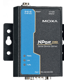
Az NPort soros-ethernet szerverek a mai napig a legnépszerűbb termékek

Bár nyomtatókkal nem kereskedünk, a kommunikációs eszközök interoperabilitását viszont tudjuk biztosítani. A Moxa elkötelezte magát arra is, hogy az eszközök az elkövetkezendő 10 évben is együtt tudjanak működni olyan régi operációs rendszerekkel (pl. DOS, Windows NT, Windows 2000, XP, Linux 2.4 stb.), amelyeket még mindig használnak ipari alkalmazásokhoz, hiszen azóta is megfelelően működnek, és túlságosan nagy